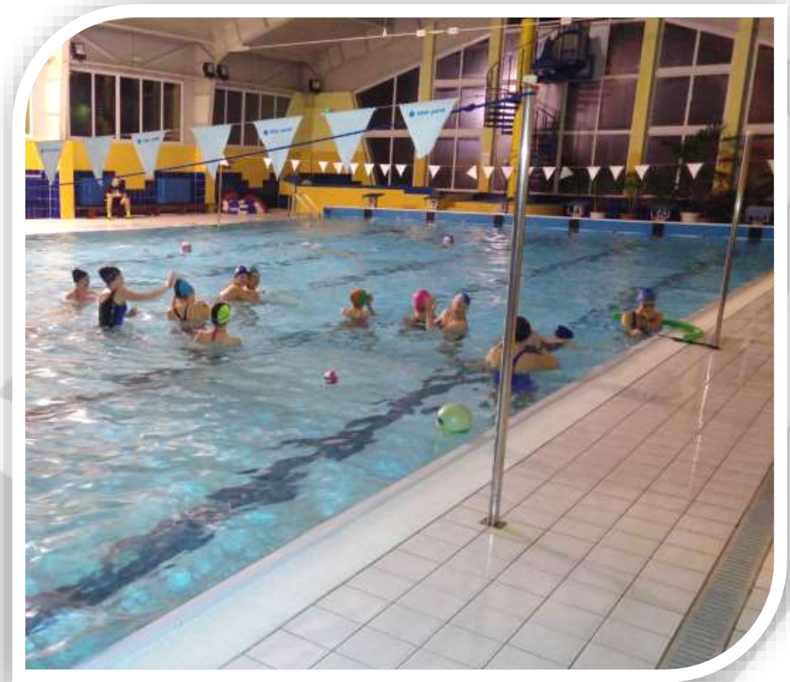
Konsultacja w Cmolasie