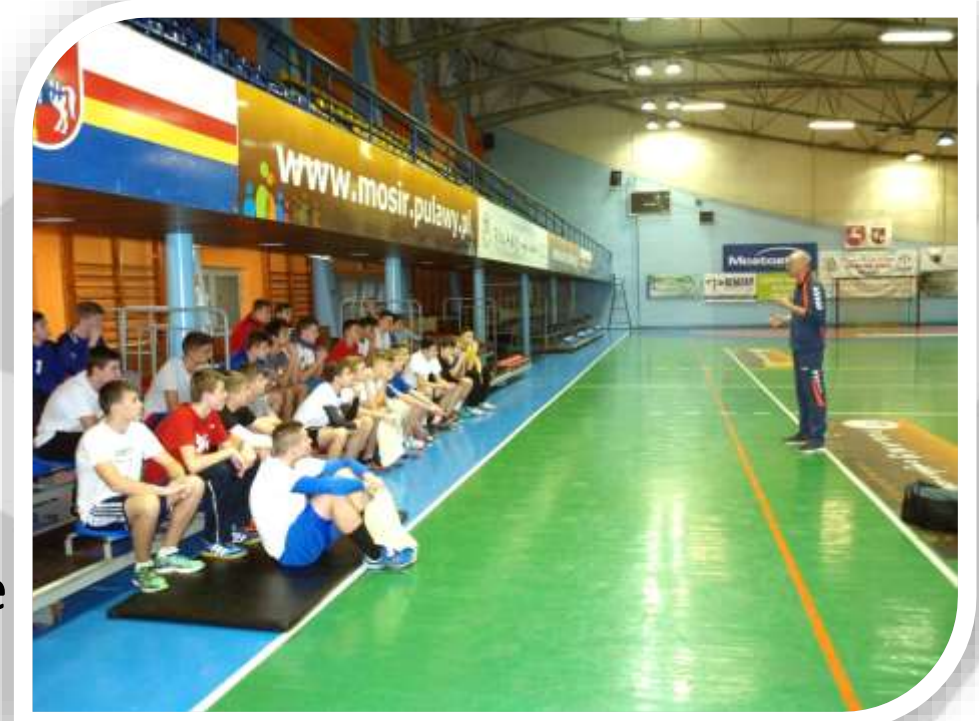
Konsultacja w Puławach