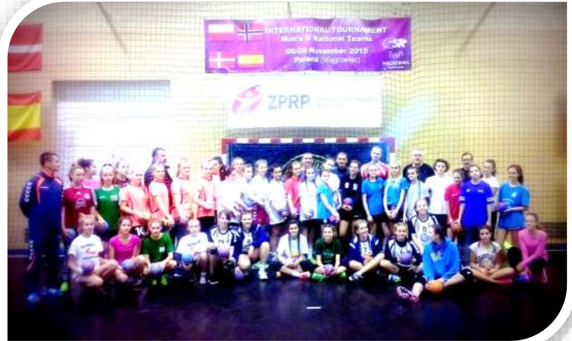
Konsultacja w Wągrowcu

Przedmiot ubezpieczenia: następstwa nieszczęśliwych wypadków polegające na funkcjonalnym uszkodzeniu ciała. Nieszczęśliwym wypadkiem są również urazy spowodowane wysiłkiem własnego ciała, w tym urazy krążków międzykręgowych kręgosłupa. Ochroną ubezpieczeniową objęte są również następstwa krwotoku śródczaszkowego, zawału serca, zakrzepowego zatoru płucnego, zakrzepowego udaru mózgu.