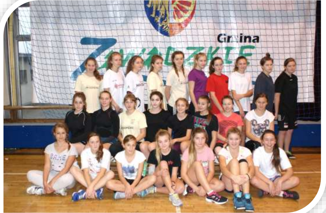
Konsultacja w Zawadzkiem

Ubezpieczeni mają możliwość żądania od Ergo Hestia udzielenia informacji o postanowieniach zawartej umowy ubezpieczenia (polisa nr 436000081737 w zakresie, w jakim dotyczą praw i obowiązków ubezpieczonego