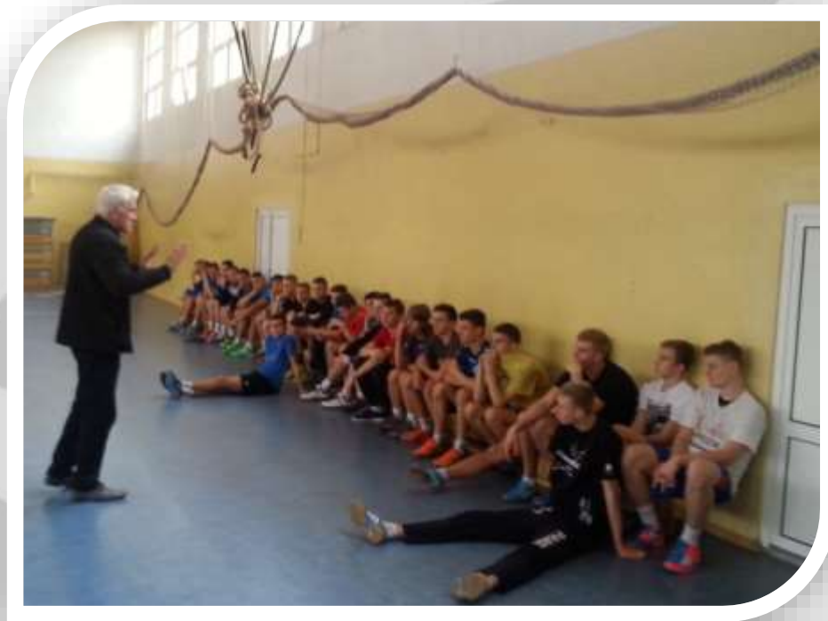
Konsultacja w Spale