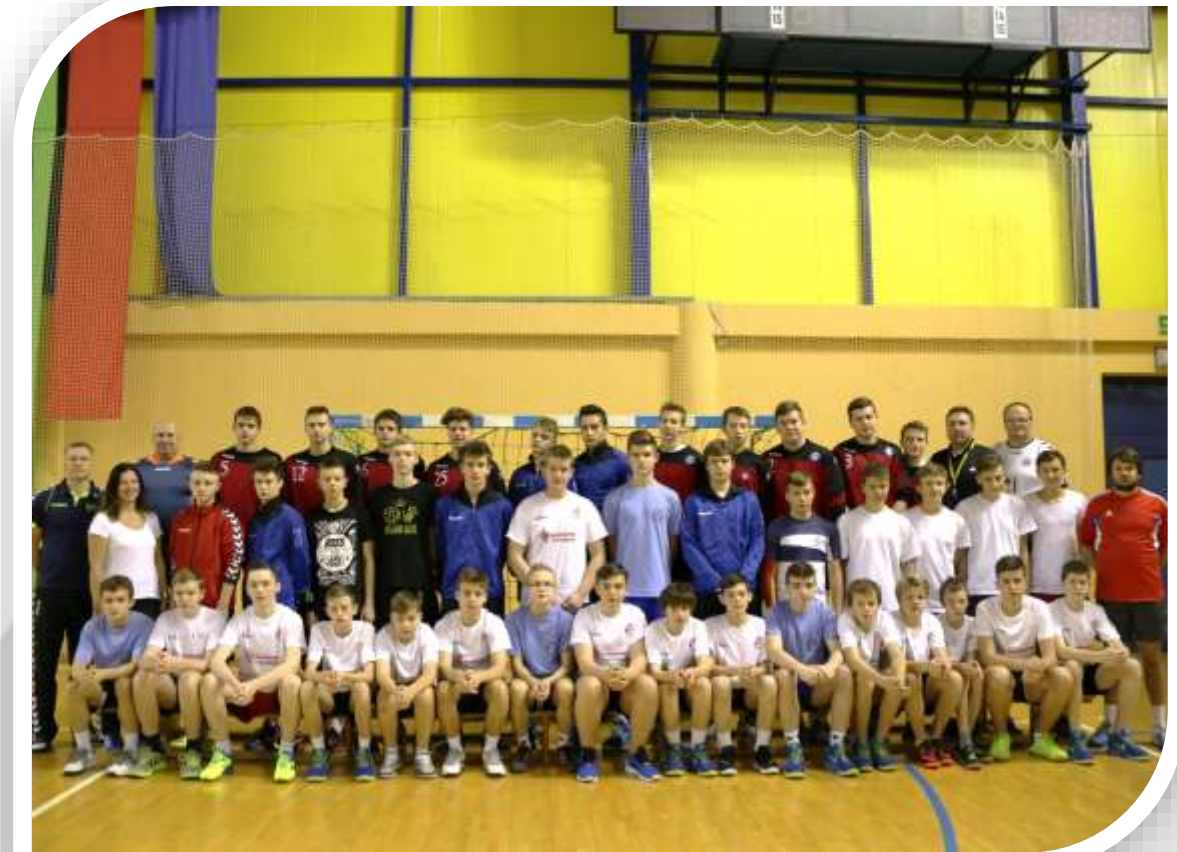
Konsultacja w Spale