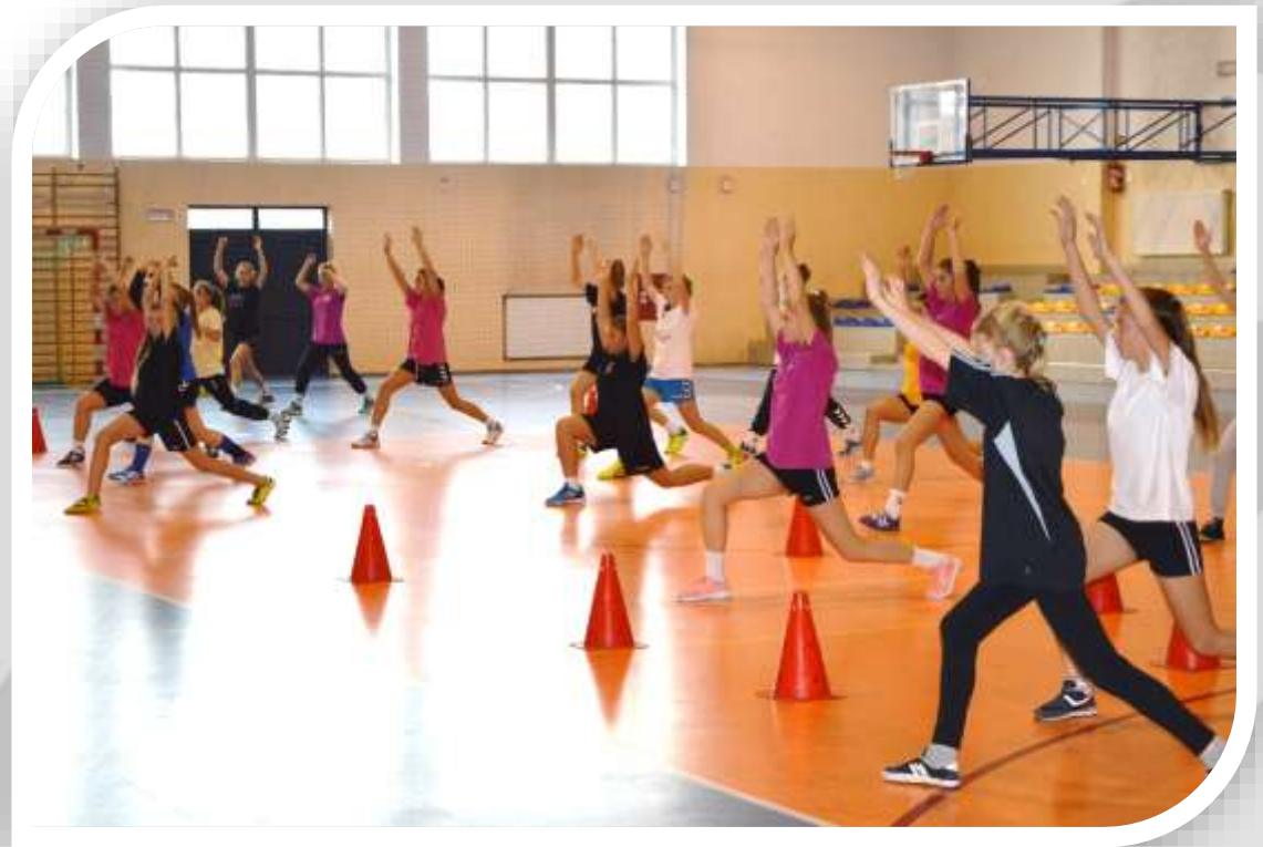
Konsultacja w Brodnicy